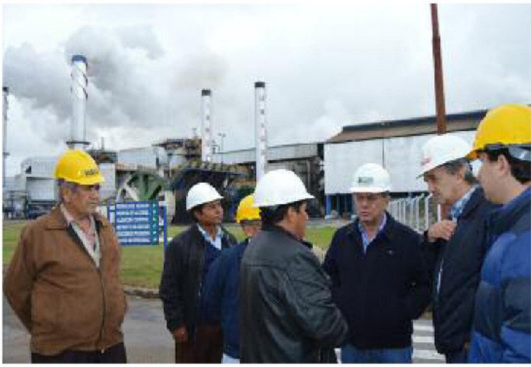
VISITA. Ejecutivos de Unagro recorrieron las instalaciones del ingenio con autoridades e invitados

El empresario, indicó que desde hace tres años se viene invirtiendo $us 50 millones en la factoría para ampliar sus capacidad de molienda y que este proyecto está en su fase final, lo que per-