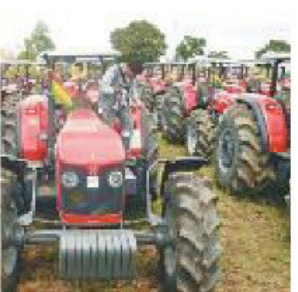
MÉTODO. El MDRT suscribirá acuerdos con los gobiernos municipales del país

El Gobierno creó el Programa de Centros Municipales de Servicios en Mecanización Agrícola, con el que fortalecerá las capacidades de los sistemas de producción agropecuaria de los municipios del país. A través de este programa, el Ministerio de Desarrollo Rural y Tierras (MDRT) transferirá maquinaria, equipos, implementos agrícolas, capacidades técnicas y hará seguimiento y evaluación de la ejecución de la actividad, de un presupuesto de