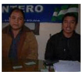
FIESTA. Maestros se agasajarán

casi $us 35 millones. El programa se crea con el DS 2785 promulgado el 1 de junio, en el marco de la Ley de Autonomías y del Plan Nacional de Desarrollo Económico y Social, que dispone que la soberanía productiva con diversificación en el sector agropecuario debe incrementar la superficie agrícola mecanizada, a través de la transferencia de maquinaria y equipos a pequeños y medianos productores del país.