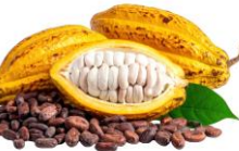
Bolivia: Exportación de Cacao y sus derivados Período 2016-2025 y avance al mes de mayo de 2026 (p)