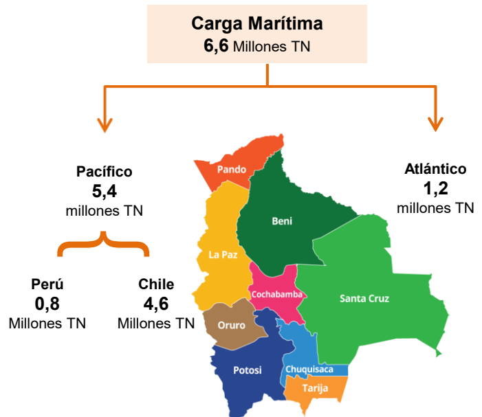
Estimación del flujo de carga marítima Gestión 2025 (En millones de toneladas)